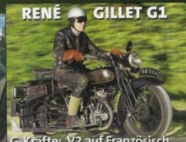
RENÉ GILLET G1