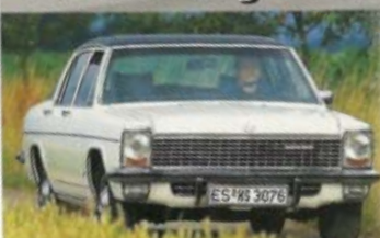
OPEL KAD B Kaufberatung