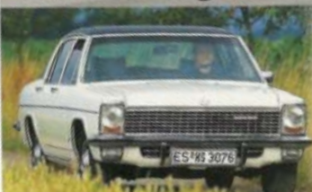
OPEL KAD B Kaufberatung