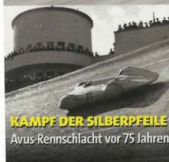
KAMPF DER SILBERPFEILE Avus-Rennschlacht vor 75 Jahren