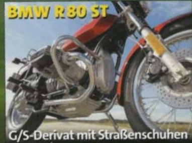
BMW R 80 ST

Wir fahren den mysteriösen Technik- Versuchsträger mit dem markanten Gesicht